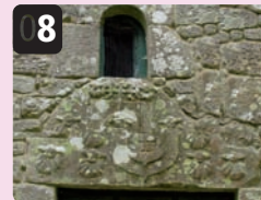
8 Escudón de Rodrigo de Luna (s. XV), en el dintel oeste de la ermita del Santiaguño.