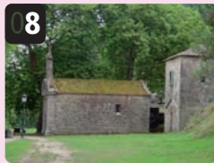
8 Ermita del Santiaguño. Obra del Arzobispo Rodrigo de Luna (s. XV), Reformada en el siglo XIX.