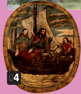
4 Lienzo que representa la llegada del cuerpo del Apóstol a Iria Flavia.