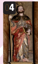
4 Santiago "O Parrandeiro".

07 Fuente del Carmen , obra del maestro santanderino Pedro de La Bárcena (1.577), reformada en 1789. Iconografía jacobea, en la hornacina el Apóstol bautizando a la Reina Lupa en el cuerpo inferior, representación de la Traslato, en el Inferior la Virgen del Carmen, remplazada por la Virgen de los Dolores, de gran devoción por las parturientas.