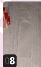
8 Tumba del canónigo Gregorio.